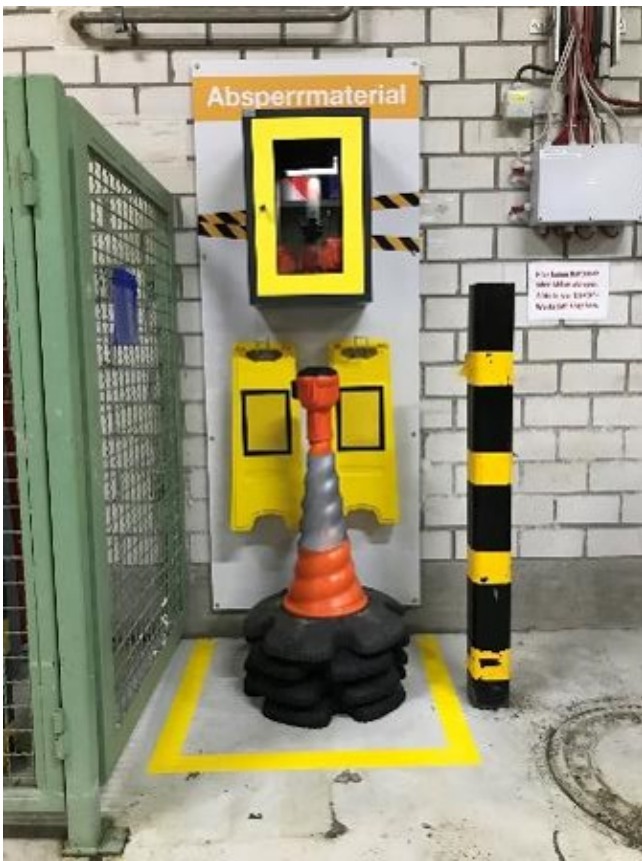
Station mit Absperrmaterial