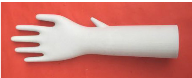
Eine Lasche dient als Ausziehhilfe