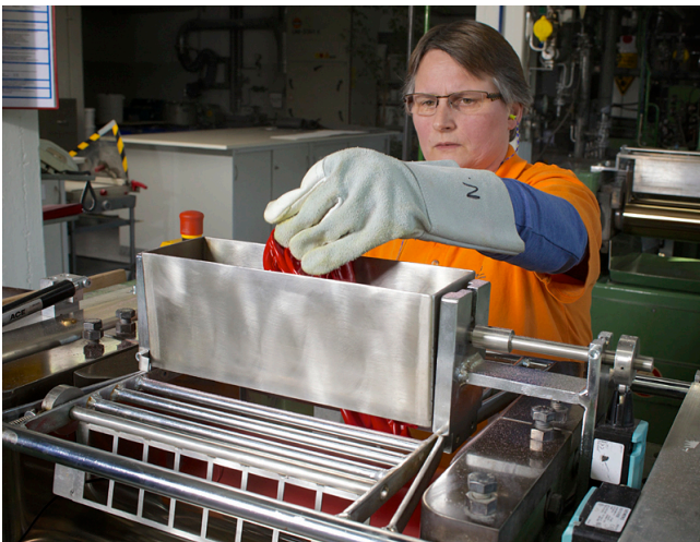
Sichere Materialzugabe am umgebauten Walzwerk