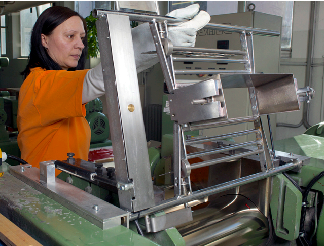
Reinigungsarbeiten bei geöffneter Schutzeinrichtung