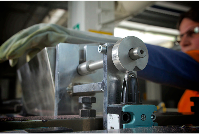
Schutzeinrichtung stoppt gefährbringende Bewegung