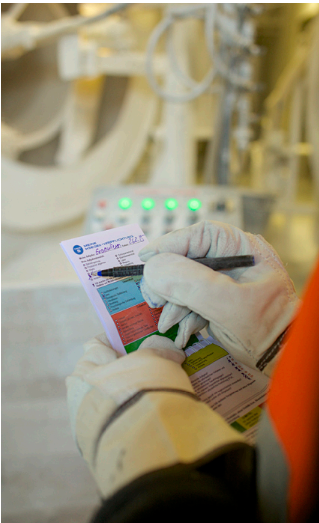
Jeder im Werk hat dieses kleine Booklet in der Tasche