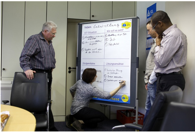
Ausarbeitung von Lösungen