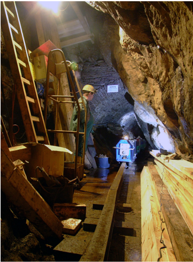
Königlich Weißtaubner Tiefer Erbstollen bei Marienberg