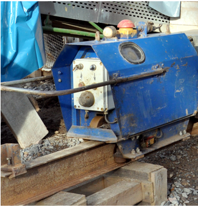
Antrieb über Gummi-Reibräder