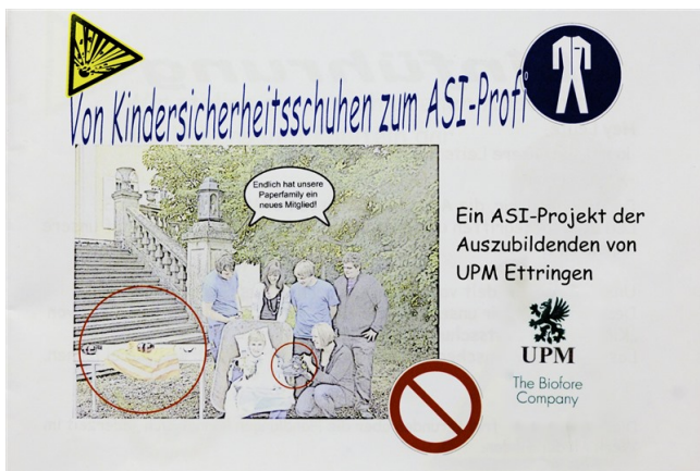
Die Texte zum Comic „Von Kindersicherheitsschuhen zum ASI-Profi“...