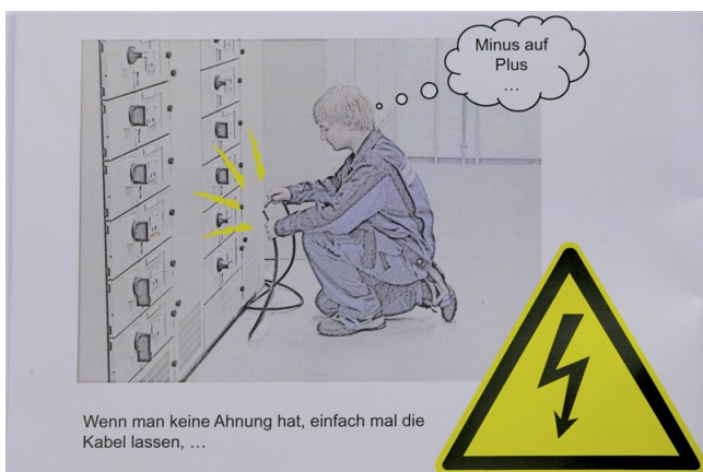
...bedienen sich bewusst der Jugendsprache.