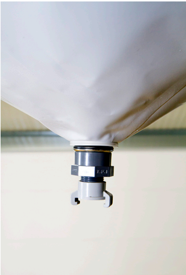
GEKA Kunststoffanschlüsse für gängige Schlauchsysteme