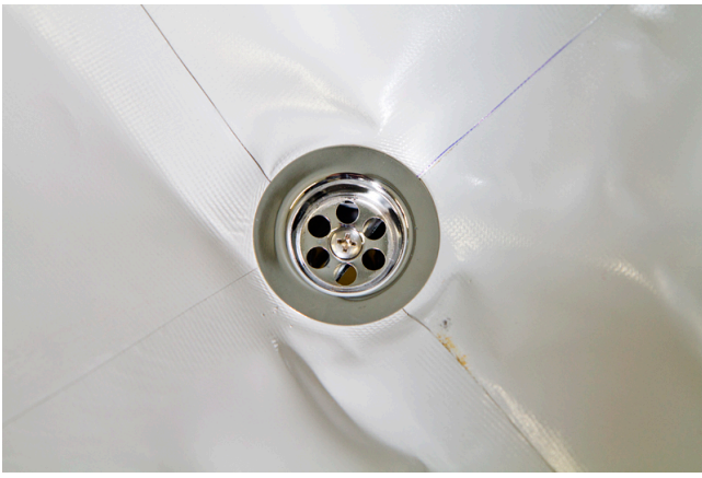
Ablaufsieb aus Metall