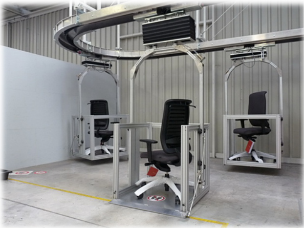
Transportanlage - heute