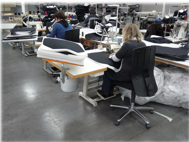
Näharbeitsplätze ergonomisch gestaltet