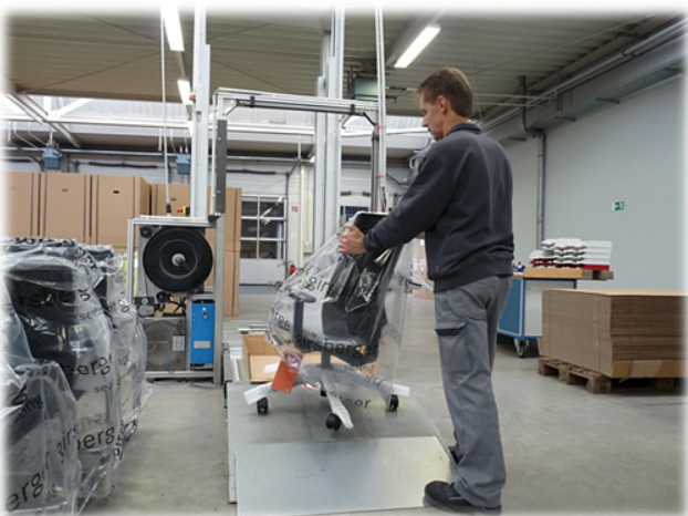
Versand - früher