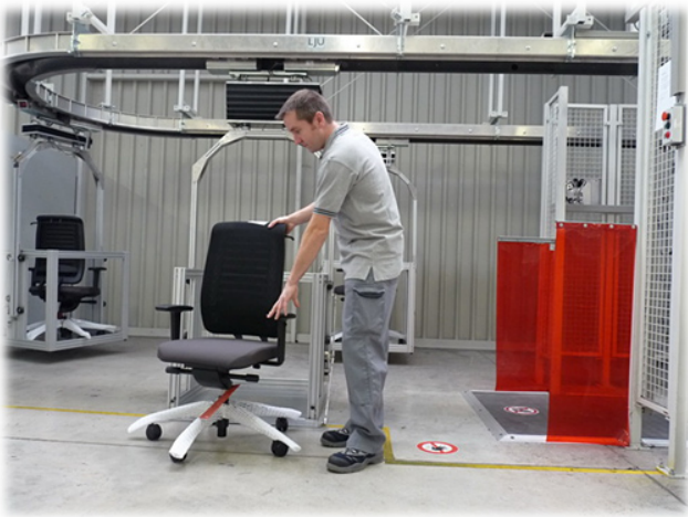
Transportanlage - früher