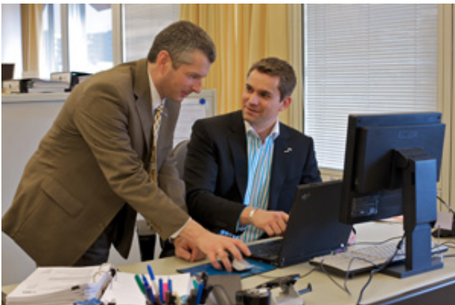
Zur Vorbereitung einer Auslandsreise gehört die detailreiche Information über das Reiseziel.