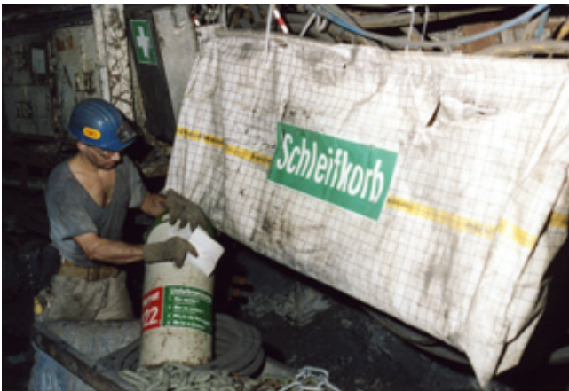
Sicherheitsbeauftragter bei der Kontrolle