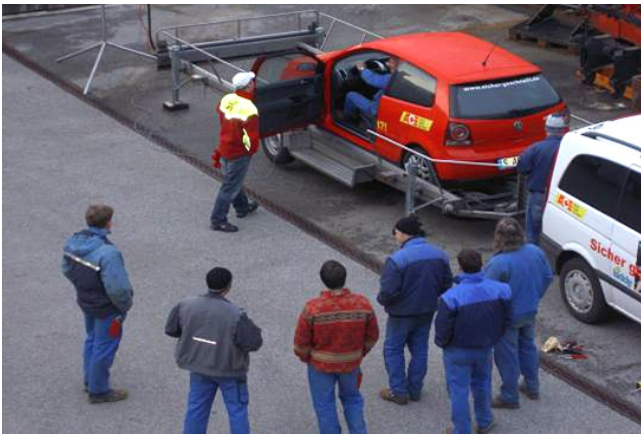
Brems- und Aufprallsimulator