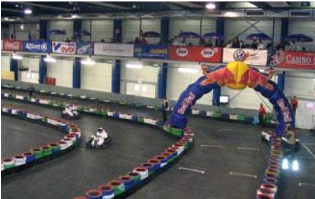
Preis: Eintrittskarten zur Gokartbahn in Salzburg