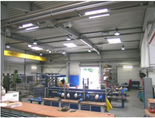
Blick in die Werkstatt