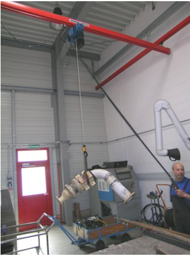
Arbeitsplatz mit Tragehilfe