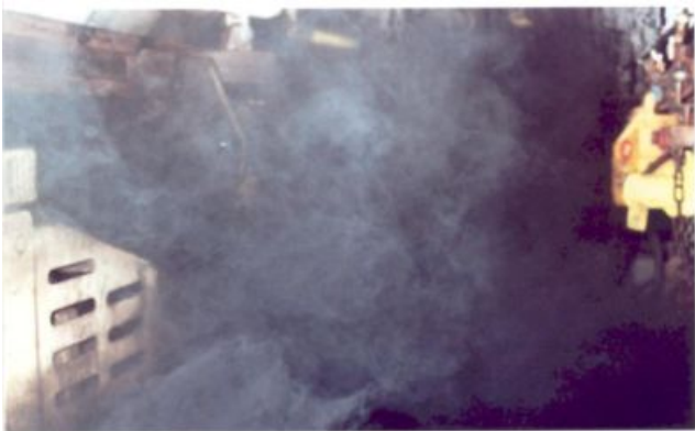
Staubentwicklung beim Ausblasen