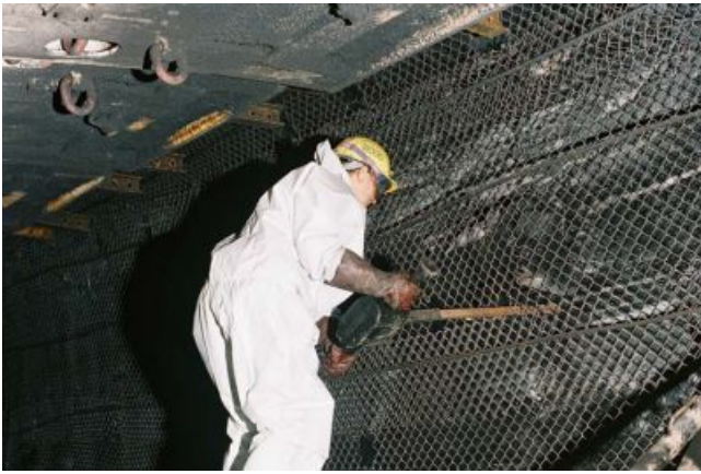
Arbeiten im Streb