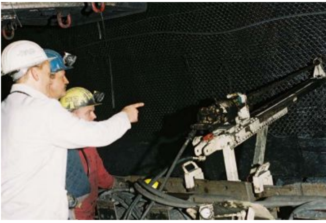
Zusammenarbeit mit der Bergbehörde