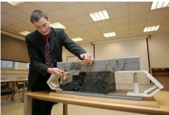
Demonstration am Modell