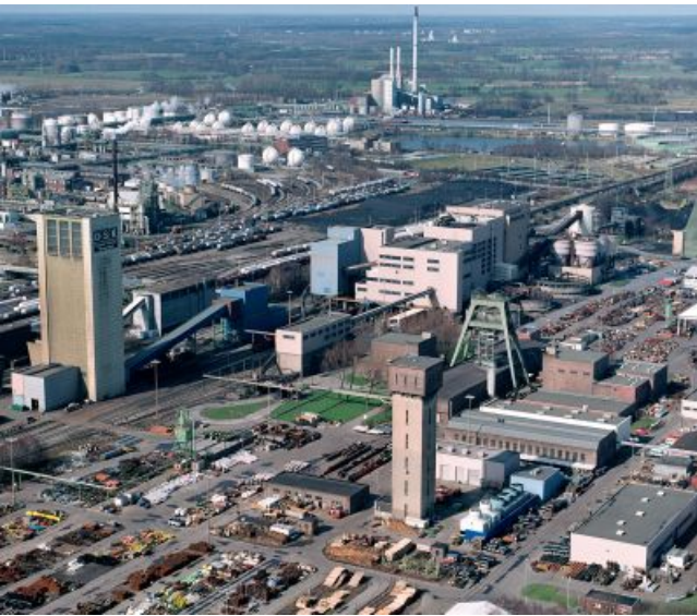
Bergwerk Auguste Victoria