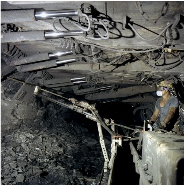
Bohrgerät im Einstz