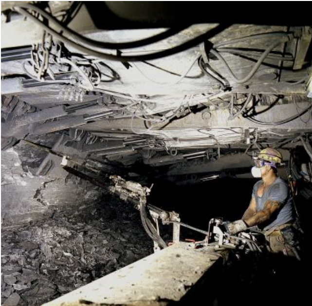
Bohrgerät im Einsatz